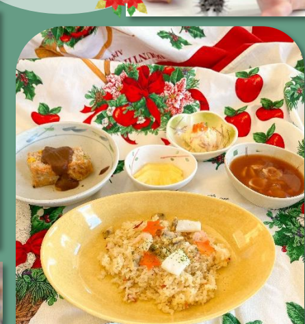
クリスマスランチ