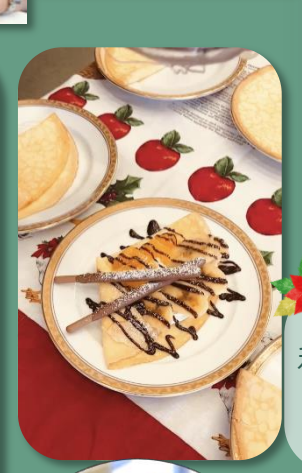
クリスマスデザート 利用者様への日頃の感謝を込めて、 スタッフによる手作りクレープを 召し上がって頂きました