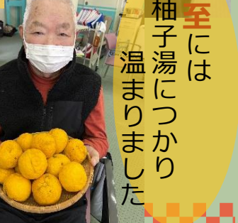
冬至には 柚子湯につかり 温まりました