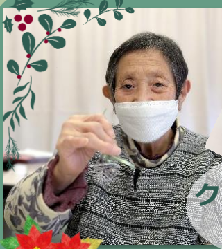
クリスマス飾り作り