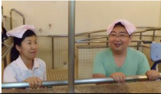
(注) 実際は混浴ではありません!

編集・発行 社会福祉法人 久喜同仁会 指定通所リハビリテーション事業所 鶴寿の里ナーシングホーム Tel 0480(24)0066